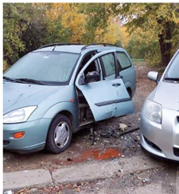
Как намираме колата си на сутринта в квартала