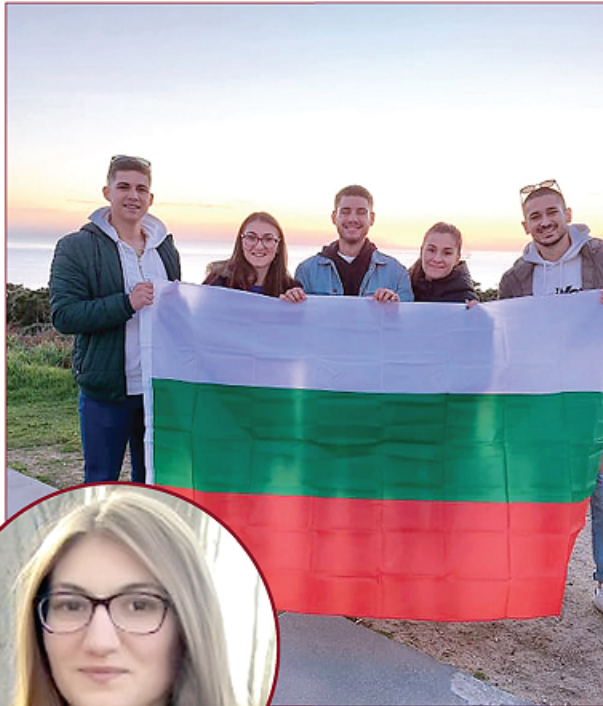
С българското знаме по чинии земи