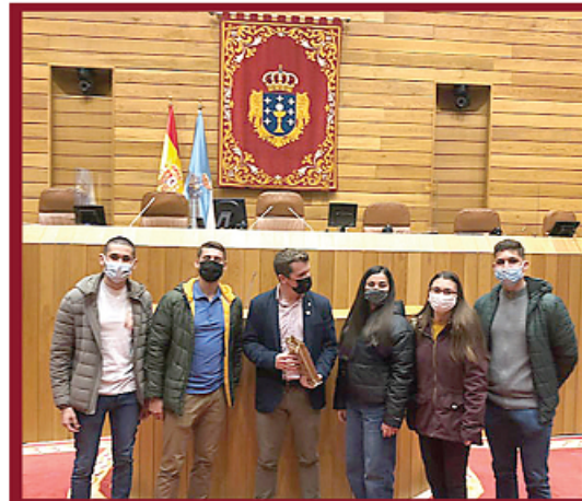
Местният парламент, който студентите са посетили, и катедралата, където свършва Пътят към Сантяго.

НАСЛЕДНИК НА ВЕСТНИК „СТУДЕНТСКА МИСЪЛ“ (1920 г.) И НА ВЕСТНИК „ИКОНОМИСТ“ (1954 г.)