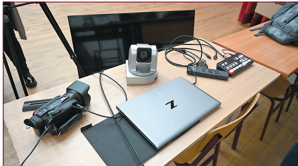
Едновременно с това бе подписан Меморандум за сътрудничество между университета и „Лигла-България“

– УНСС за поредна година е обявен за най-престижното висше училище в професионално направление „Икономика“ според работодателите и преподавателите във висшите училища. Призът показва